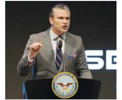
El secretario de Defensa, Pete Hegseth, indicó que Trump ordenó la acción.

El gobierno de Estados Unidos lanzó la “Operación Lanza del Sur”, una misión encabezada por el Comando Sur (SOUTHCOM) y la Fuerza de Tarea Conjunta Lanza del Sur (SOUTHERN SPEAR) para combatir al narcotráfico en América Latina.