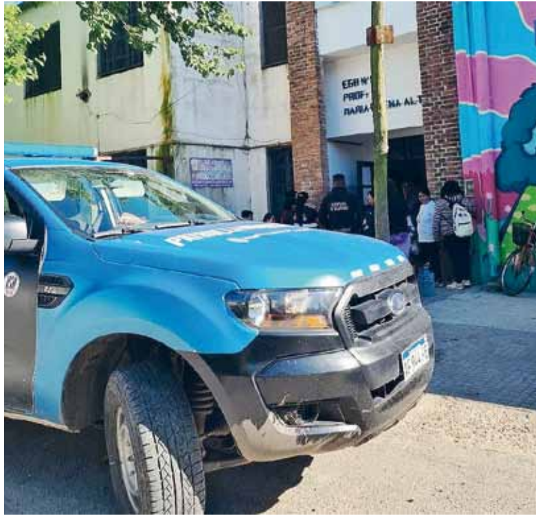
Vigilada. La Escuela 80 de City Bell amaneció con custodia.

“Los atacaron a trompadas, a patadas, incluso los agarraron de los pelos. A la directora le dieron una patada en la pierna y la hicieron sangrar, ya que le impactaron justo en una várice”. Por