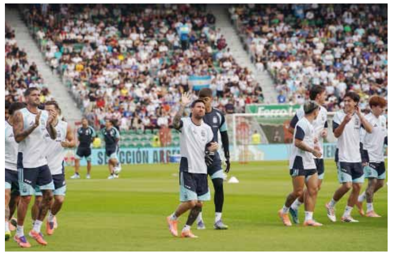
Locura. La desató el equipo de Lionel Scaloni y el capitán argentino con un entrenamiento abierto.

club en 2019, destacó además que este tipo de acontecimientos benefician a la ciudad: "Tener a la campeona del mundo en Elche hace que la ciudad siga creciendo".