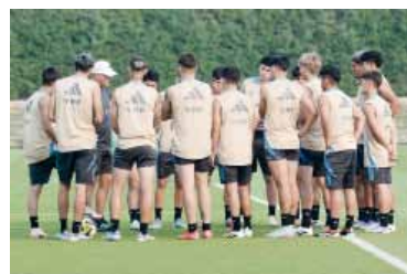
Puesta a punto. La última práctica del plantel argentino antes del encuentro por los 16avos de final.

El elenco dirigido por Carlos Cariño, tuvo un desempeño irregular en el Grupo F: cayó ante Corea del Sur (2-1) y Suiza (3-1), pero