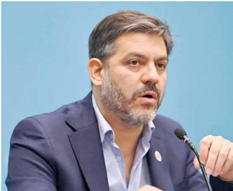
El reclamo. El ministro de Gobierno bonaerense, Carlos Bianco.

Bianco también comentó que pese a no tener las respuestas deseadas por parte del anterior jefe de Gabinete y ministro del Interior, Guillermo Francos, "al menos tenían la decencia de recibirte". "Quizá (Santilli) recibió la instrucción de cortar la relación y eso es coherente con lo que viene pasando últimamente con la provincia de Buenos Aires, a la cual no solo discriminan en términos finan-