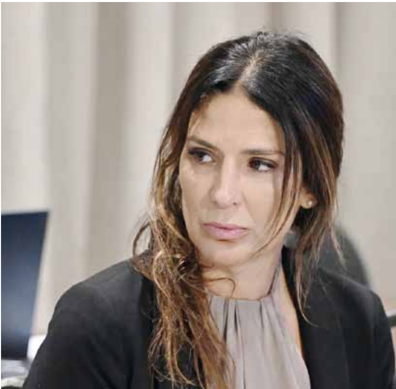
Veredicto. Se conocerá el martes la decisión sobre la acusada de participar en un documental que provocó la nulidad del juicio por la muerte de Diego Maradona.