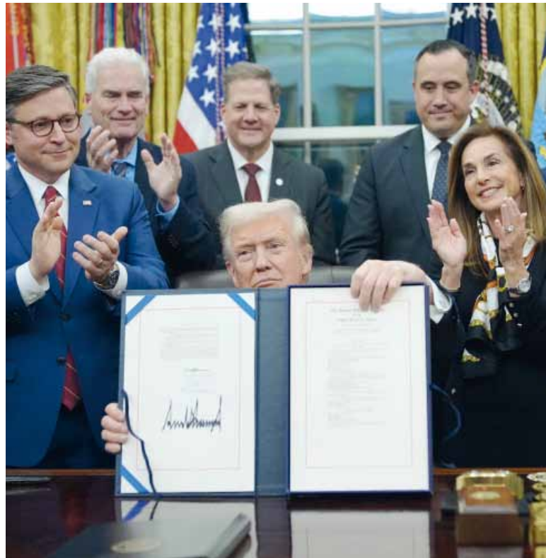
Agradecimiento. Trump mencionó a los 8 legisladores demócratas que permitieron avanzar con la ley.

Con la reapertura, los trabajadores retomaron a sus puestos y recibirán sus sueldos atrasados.