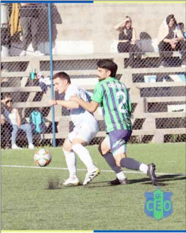
Quando se enfrentaron por la primera fecha, Balonpié se impuso por tres a cero en Olavarría.

Así está la tabla de la Zona 4 Región Pampeana Sur