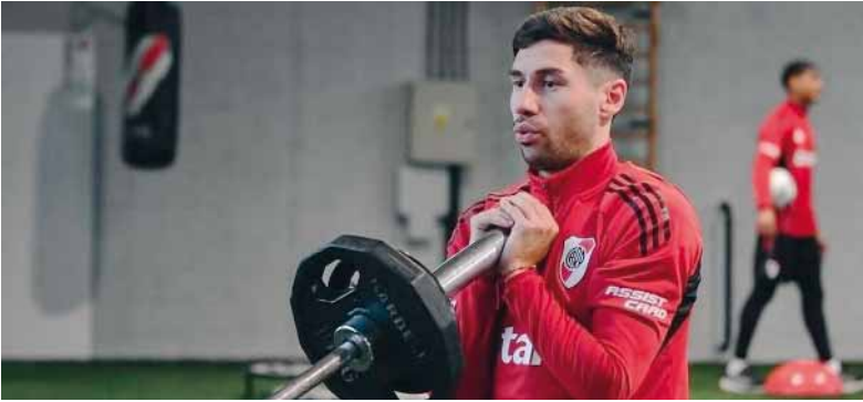
En duda. El lateral derecho estaría complicado para llegar al partido y podría ser reemplazado por Fabricio Bustos.

El lateral sufrió una molestia en la rodilla izquierda y no se entrenó con normalidad a pocos días del partido ante Vélez, donde River buscará el pasaje a la Copa Libertadores 2026.