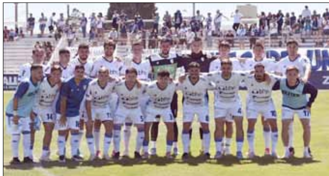
"La Crema" definirá mañana, de local.

El Consejo Federal de AFA dio a conocer el programa de partidos correspondientes a las revanchas de la Tercera Etapa, es decir los cuartos de final, de la Reválida perteneciente al Torneo Federal A. En busca de conocer cuáles serán los equipos semifinalistas este año, en busca del segundo ascenso a la Primera Nacional, se disputarán estos encuentros: