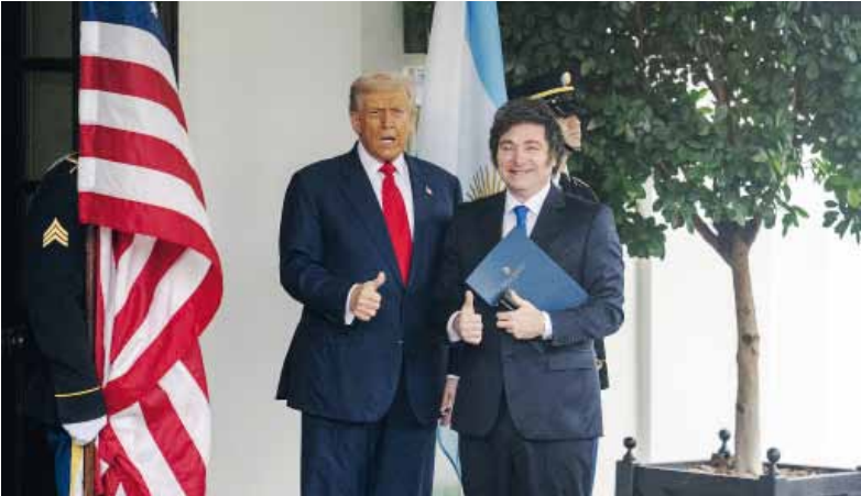
Las partes. Milei y Trump, cara a cara, un mes atrás.

El documento subraya que Argentina eliminará barreras no arancelarias como licencias de importación y formalidades consulares, y se comprometió a desmantelar gradualmente el impuesto estadístico para productos estadounidenses. Asimismo, se alineará con estándares internacionales