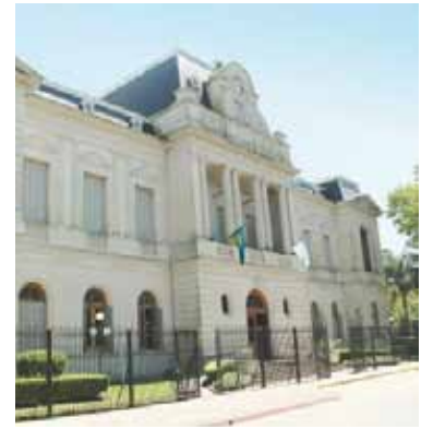
El municipio de Zárate.

Nombran a una IA como funcionaria en Zárate