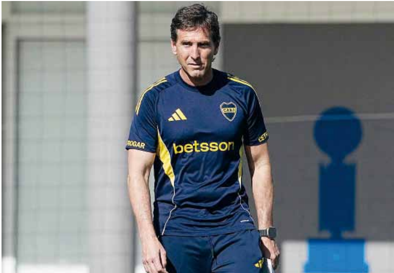
Planificación. El técnico xeneize prepara el encuentro ante los de Victoria sin descuidar detalles para lo que se le viene a su equipo.